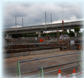
基礎(配筋工事)工事の様子