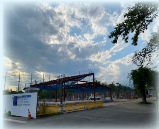
建物の柱の配筋を組んでいる様子です!!