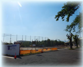
杭工事が無事に終わり 貯水タンクが無くなった直後の全景