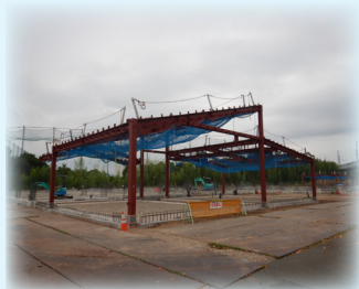
鉄筋工事により一部建物の外郭が見えてきました!!