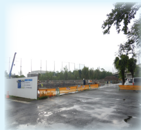
基礎工事中の足場を組んでいる様子