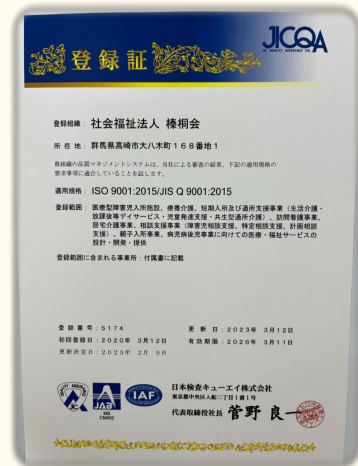
総合受付にて掲載中