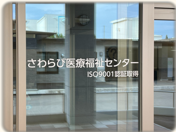
さわらび医療福祉センター正面玄関

2019年から認証を受けていたISO 9001の更新及び拡大審査を行い、2023年2月9日付で更新することができました。移転の際に新規開設した事業はもちろん既存の事業につきましてもシステムが変わった事もあり、審査の際は終始不安ではありました。審査の結果としましては、大きな指摘もありませんでした。引き続きより良いサービスを利用者様に提供するため、日々業務の改善や見直しをし、日々利用者様の事を思い運営を行なっていきます。